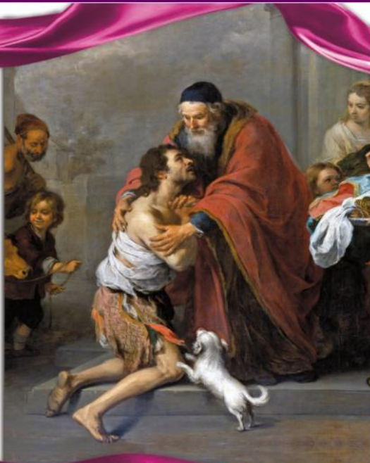
The Station of the Prodigal Son by Alessandro Costanzo Murillo, circa 1670